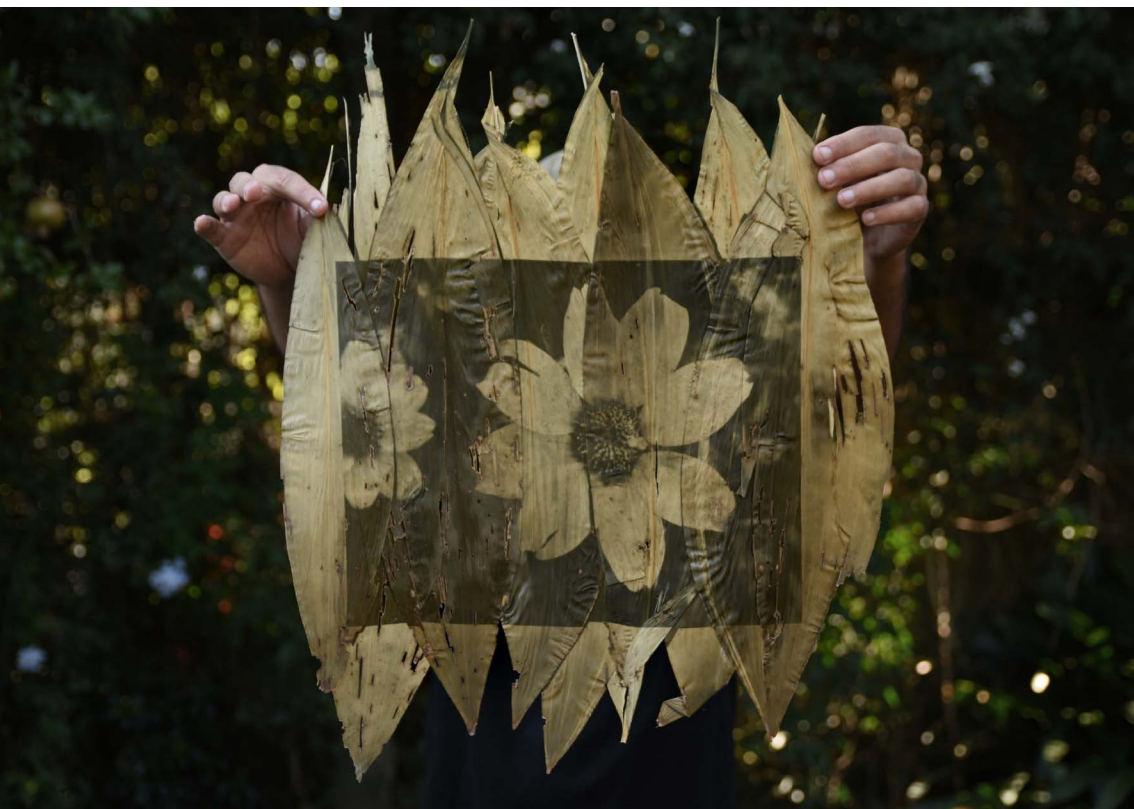
Yuyo de Santa María revelado en hojas de achiras