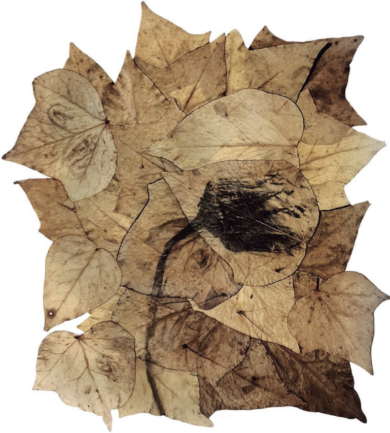
Diente de león revelado en hojas de hiedra