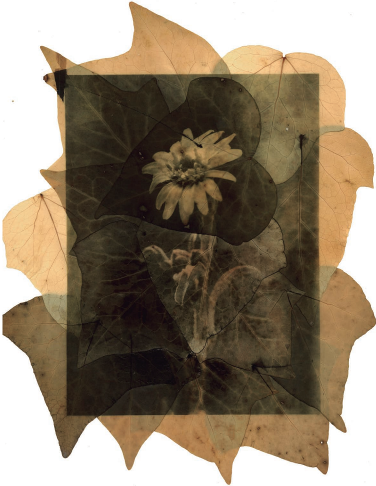
Senecio María Mole revelado en hojas de hiedra