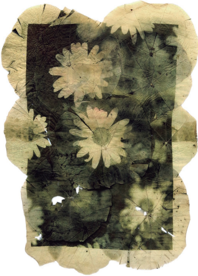
Yuyo de Santa María revelado en tacos de reina