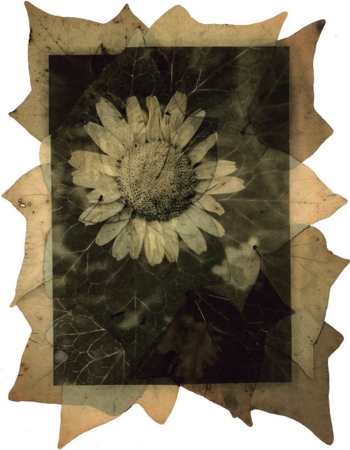
Margarita de Piria reveladas en hojas de hiedra