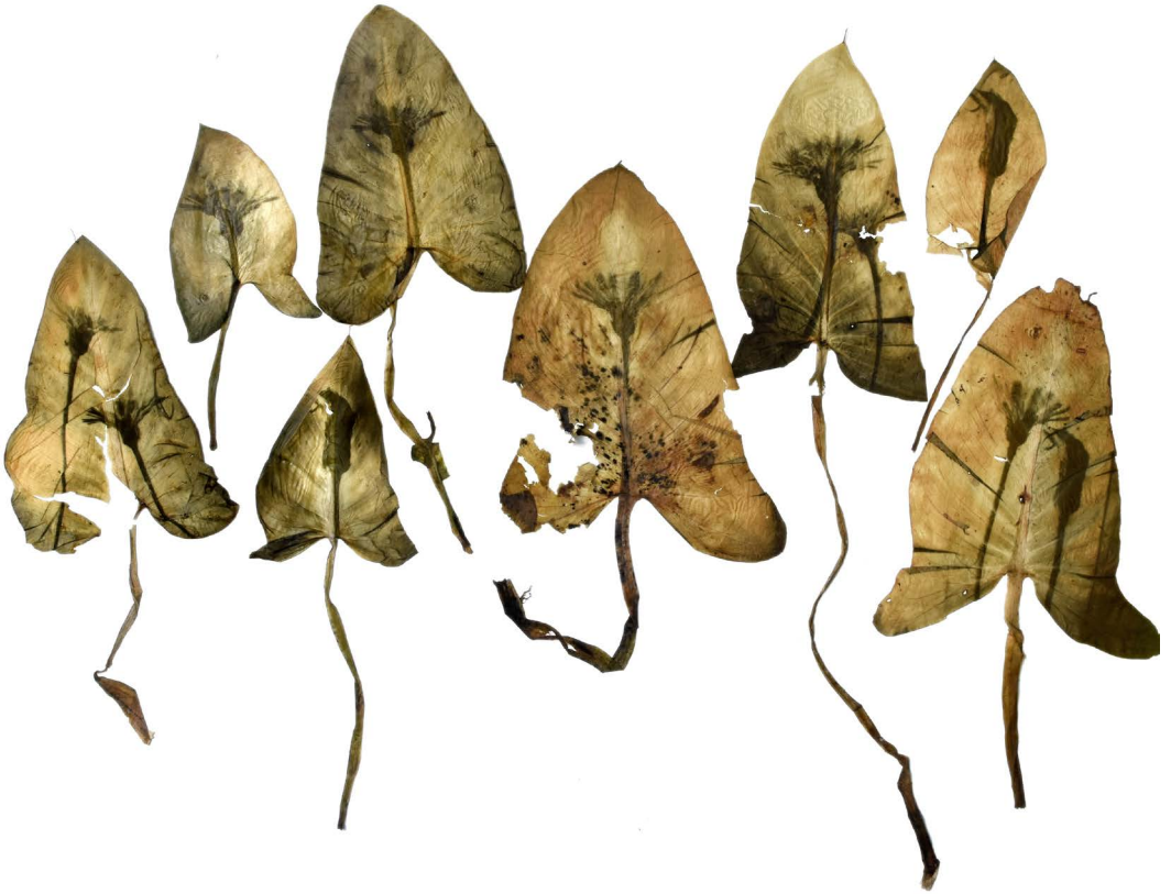
Dientes de León revelados en hojas de cartucho