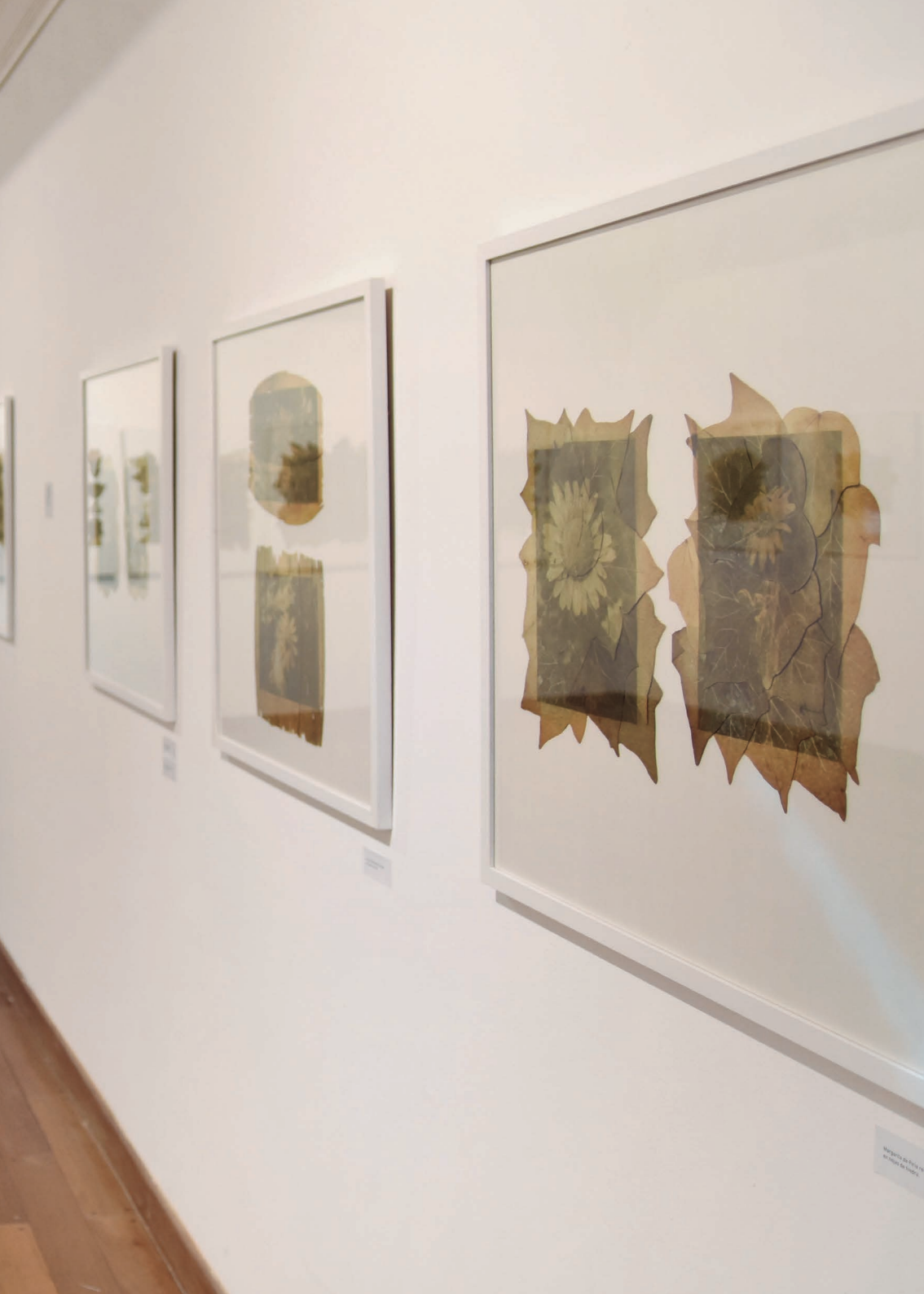
Herbario de Pavia di Carlo de Toni