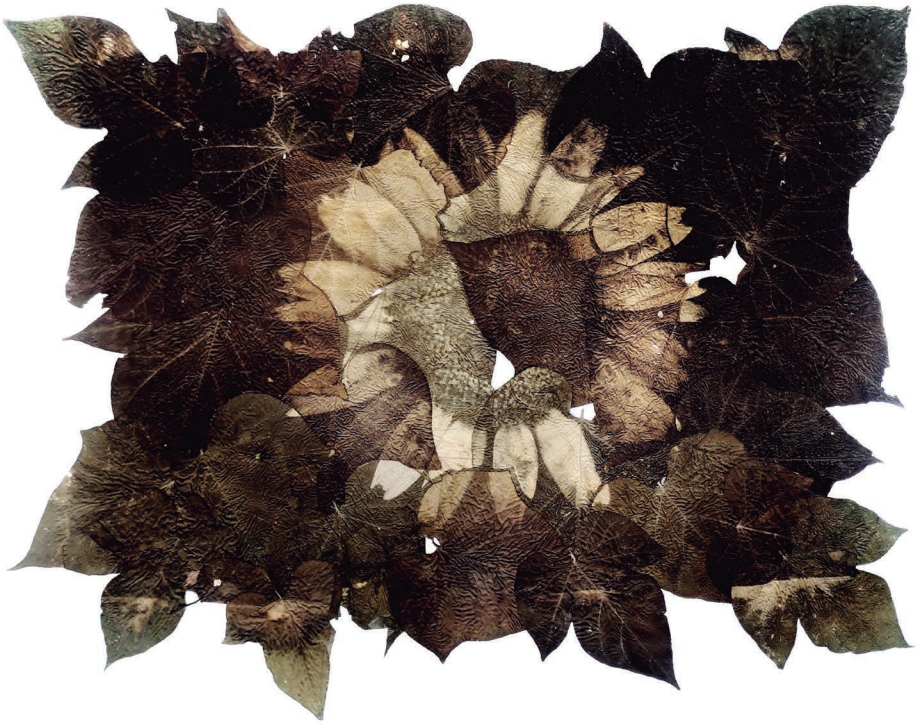
Margarita de Piria revelada en hojas de campanita