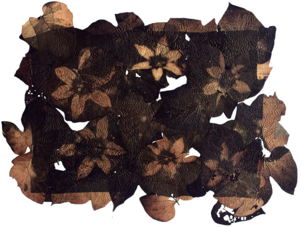
Centaurea revelada en hojas de campanita