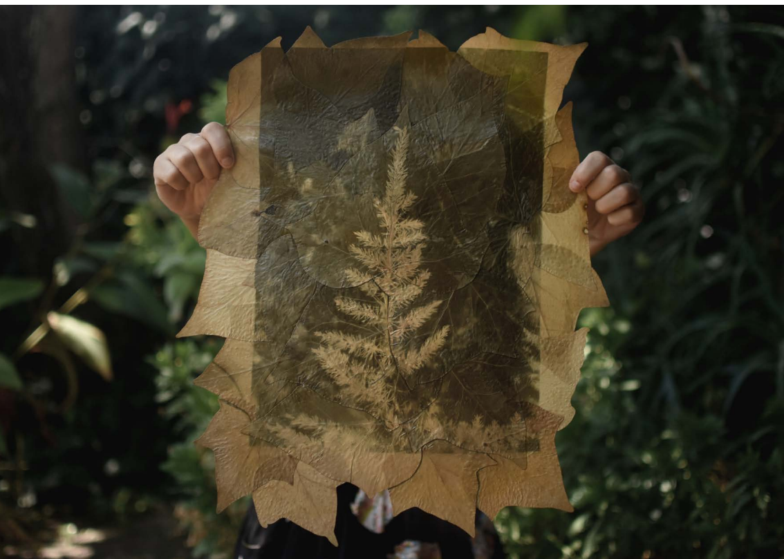
Espárrago revelado en hojas de hiedra