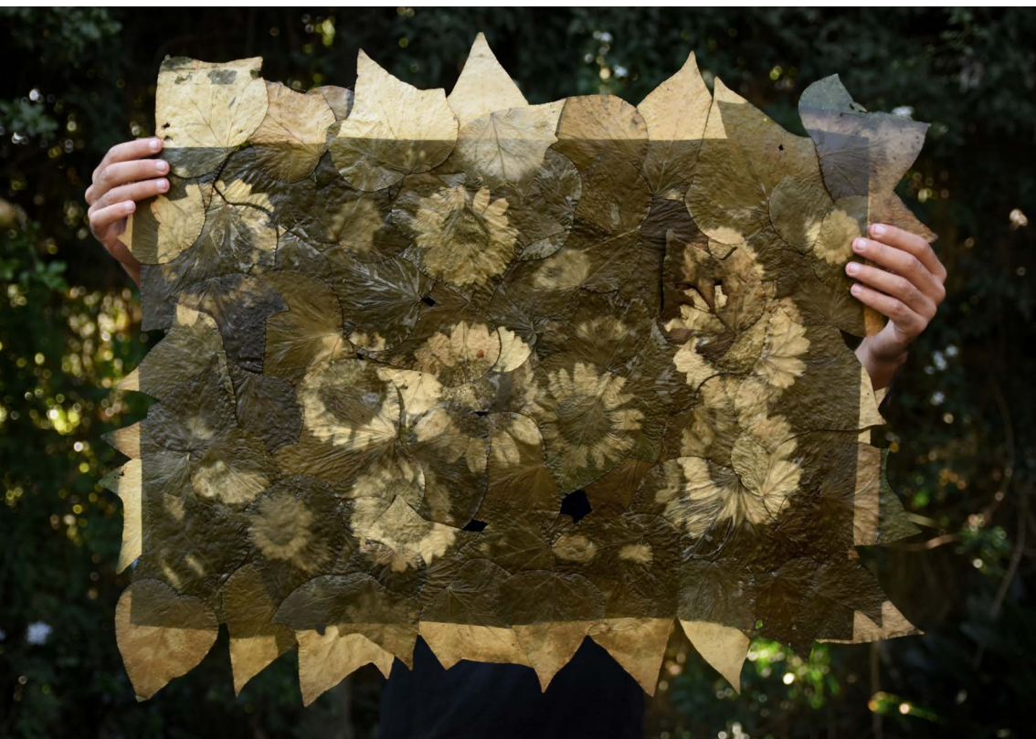
Margaritas de Piria reveladas en hojas de hiedra