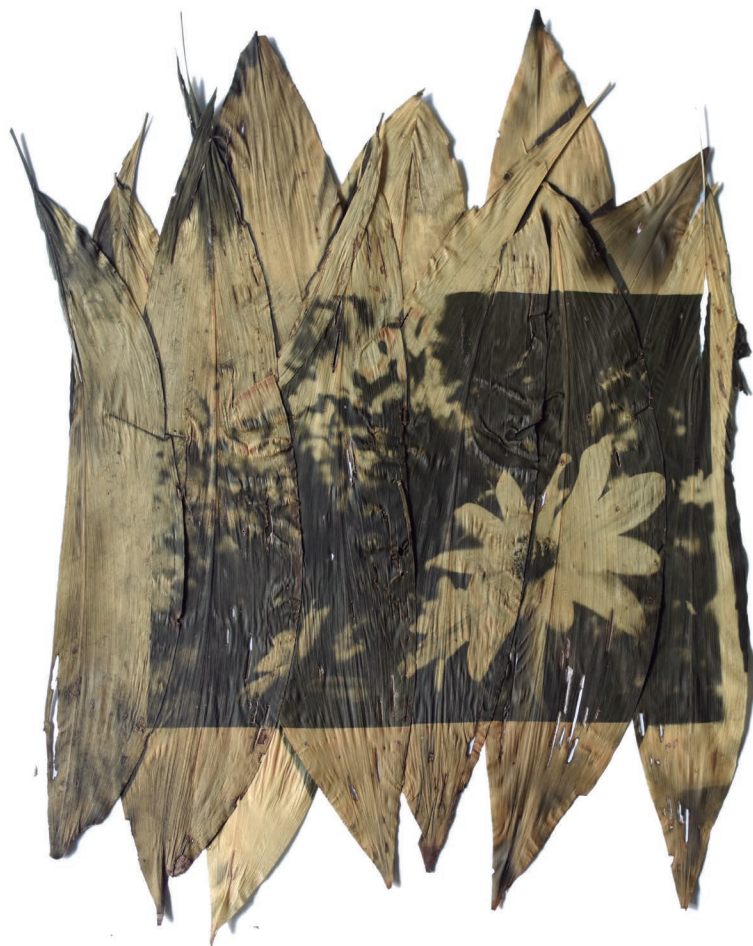
Girasol Maximiliano revelado en hojas de achiras