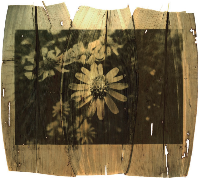
Senecio María Mole revelado en hojas de achiras