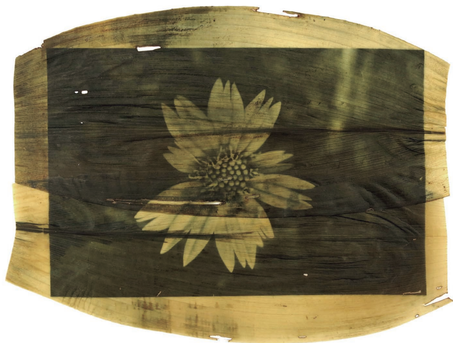
Yuyo de Santa María revelado en hojas de achiras