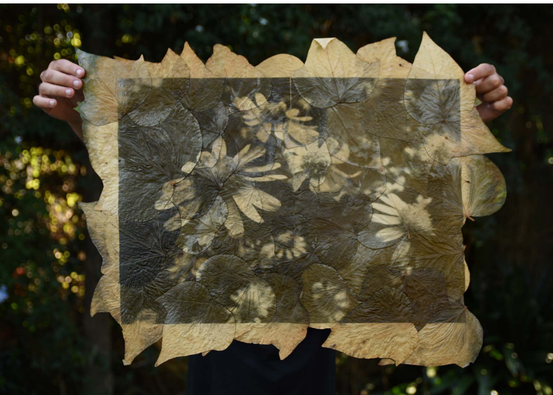
Senecio María Mole reveladas en hojas de hiedra