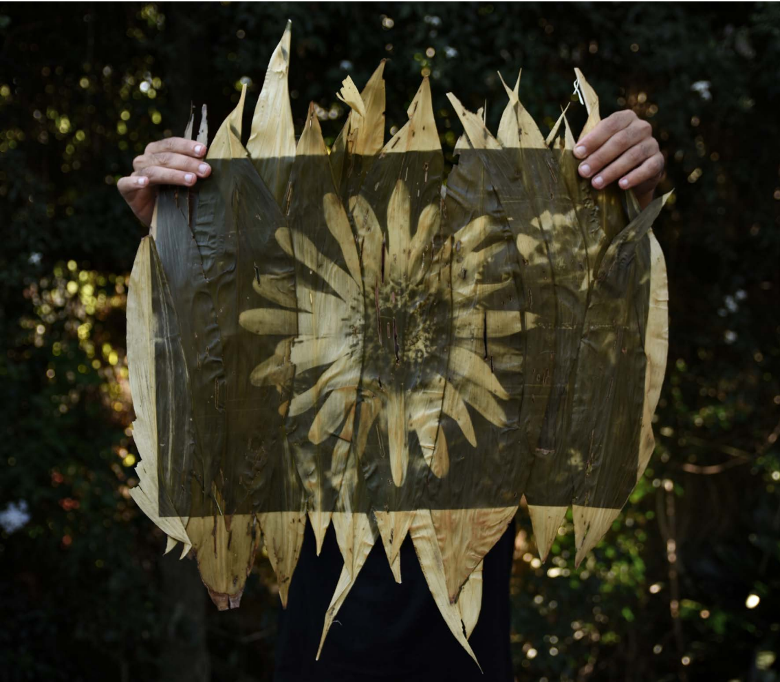
Girasol Maximiliano revelado en hojas de achiras