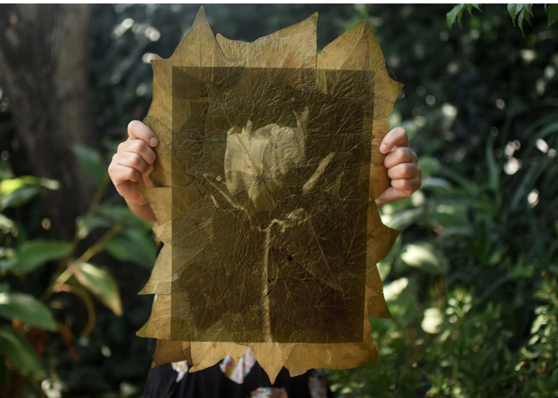
Yuyo de Santa María revelado en hojas de achiras