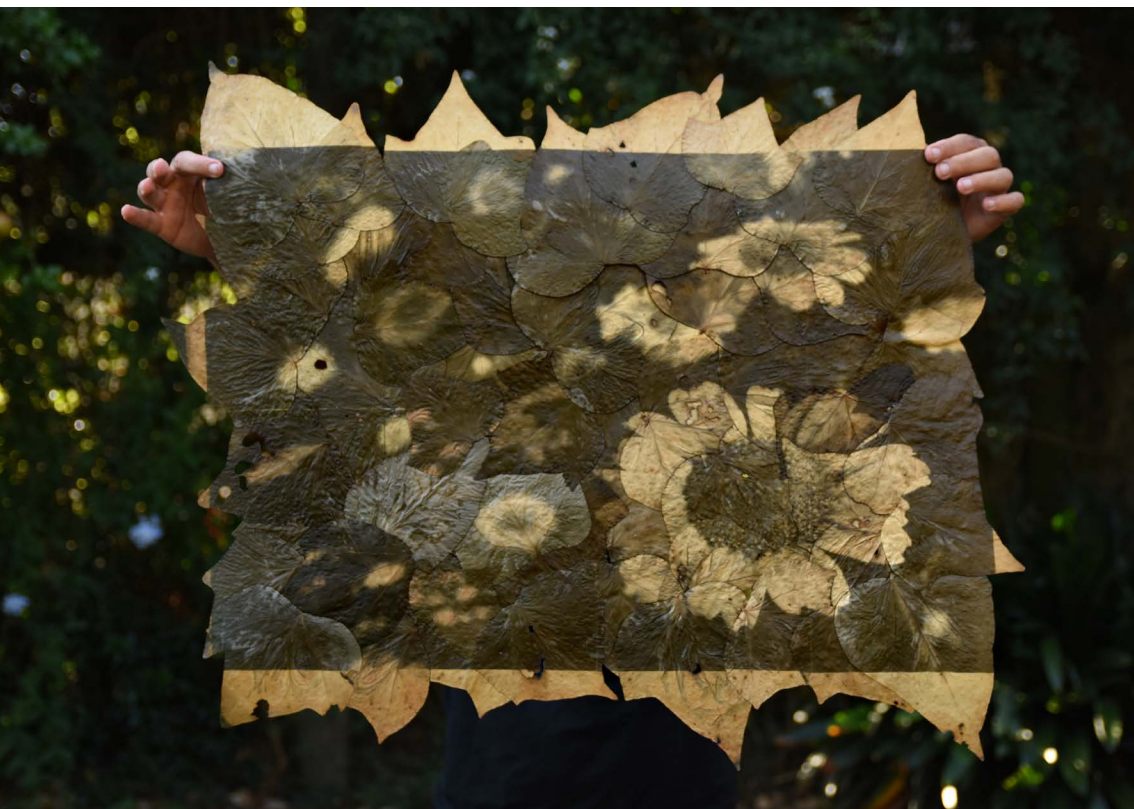
Margaritas de Piria reveladas en hojas de hiedra