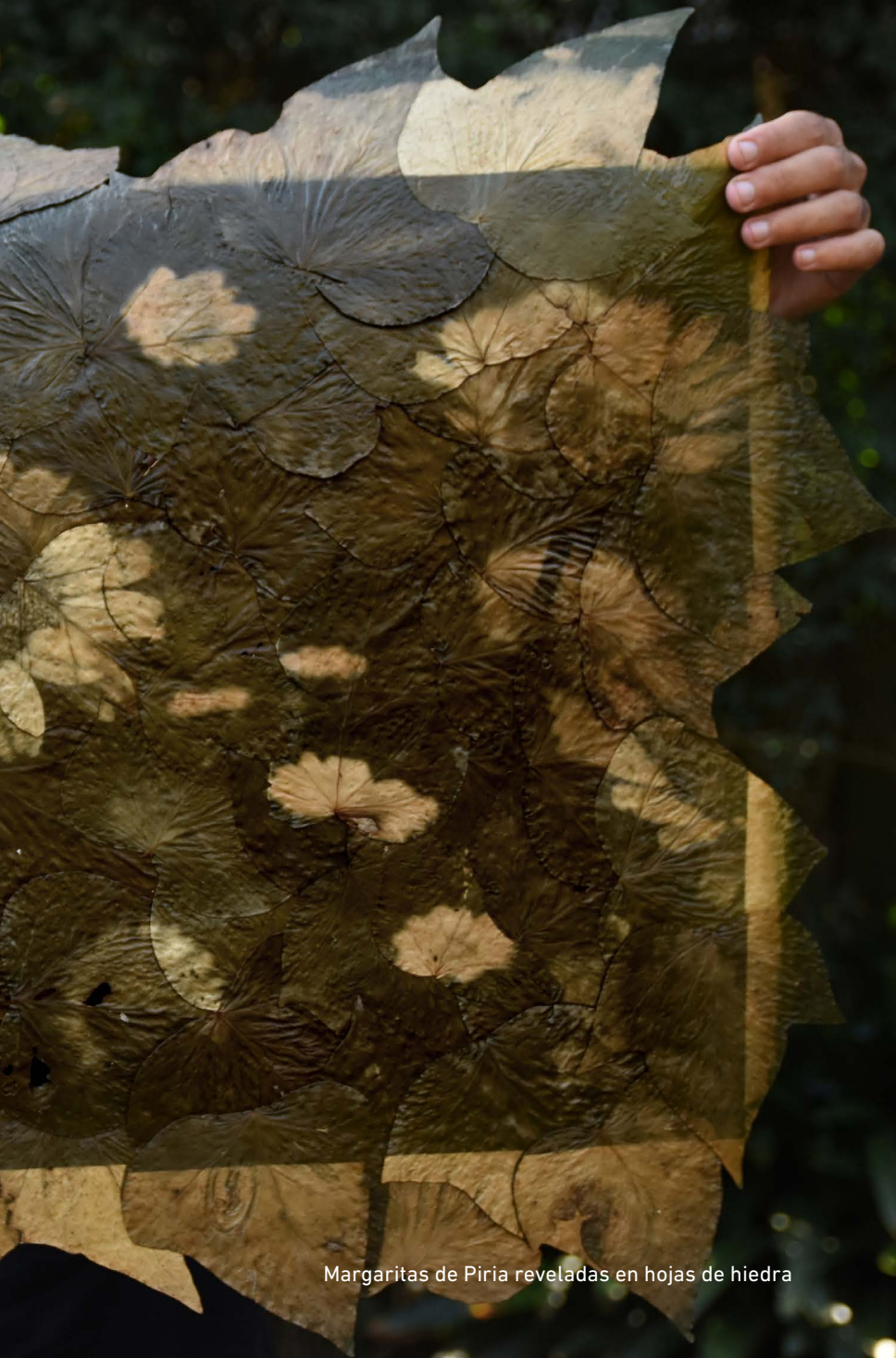
Margaritas de Piria reveladas en hojas de hiedra