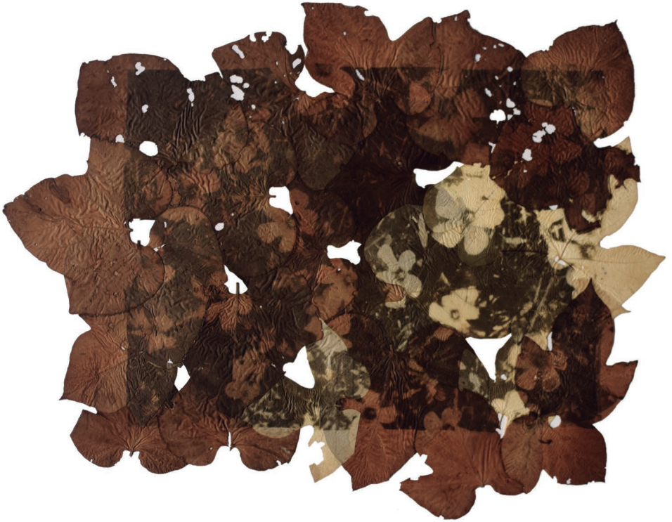
Macachines revelados en hojas de campanita